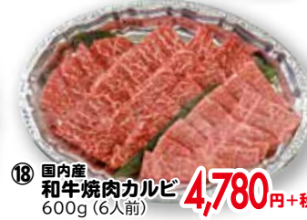
⑱ 国内産 和牛焼肉カルビ 600g(6人前)