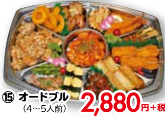
⑮ オードブル (4~5人前)