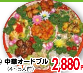
⑭ 中華オードブル (4~5人前)