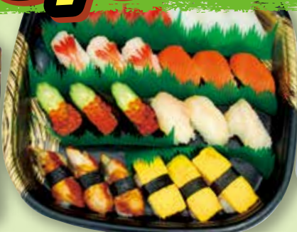
② 寿司盛り合せ 24貫(3人前)