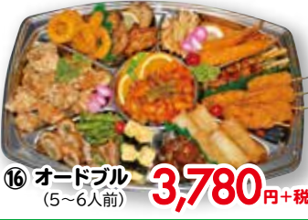
⑯ オードブル (5~6人前)