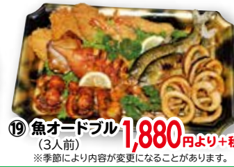
⑲ 魚オードブル (3人前) ※季節により内容が変更になることがあります。