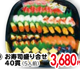
⑨ お寿司盛り合せ 40貫(5人前)