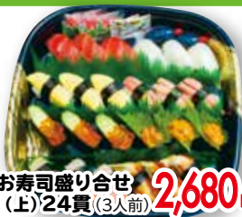
⑪ お寿司盛り合せ (上)24貫(3人前)