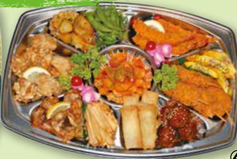
③ オードブル (3~4人前)