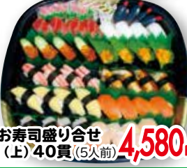
⑬ お寿司盛り合せ (上)40貫(5人前)