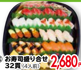
⑧ お寿司盛り合せ 32貫(4人前)