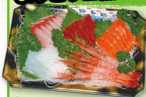
① お刺身盛り合せ (3人前) ※季節により内容が変更になることがあります。