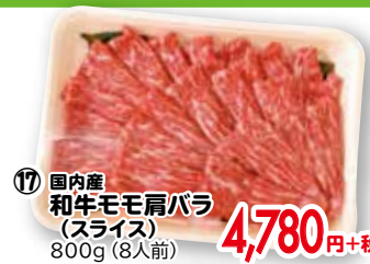
⑰ 国内産 和牛モモ肩バラ (スライス) 800g(8人前)