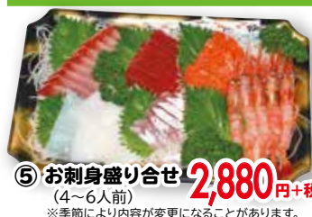
⑤ お刺身盛り合せ (4~6人前) ※季節により内容が変更になることがあります。