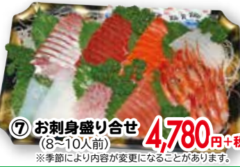
⑦ お刺身盛り合せ (8~10人前) ※季節により内容が変更になることがあります。