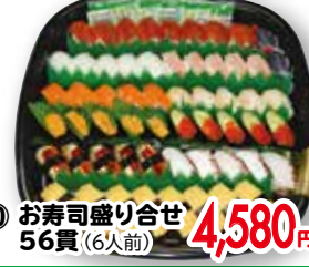
⑩ お寿司盛り合せ 56貫(6人前)