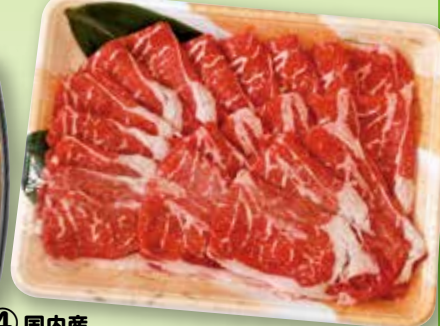
④ 国内産 牛肩ロースバラ (スライス) 400g(5人前)