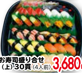
⑫ お寿司盛り合せ (上)30貫(4人前)